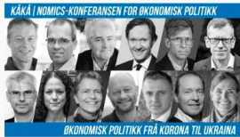
TOR 27. OKT 2022 / STAVANGEREN KÅKÅ/NOMICS-Konferansen for økonomisk politikk

program billetter deltakere KÅKÅ/NOMICS-prisen meny støttespillere