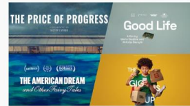
FILMVISNING HVER KVELD Filmprogram

For å sikre smidig innslipp ber vi alle gjester ha billett klar til fremvisning i døra.