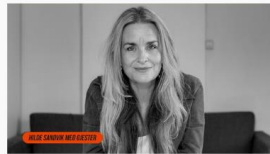
NRK P2 LIVE TOR, FRE & LØR P2 Livesending