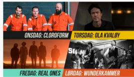
KONSERT HVER KVELD KL 21.30 Konsertprogram